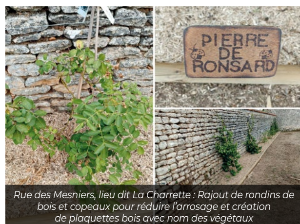
Rue des Mesniers, lieu dit La Charrette : Rajout de rondins de bois et copeaux pour réduire l'arrosage et création de plaquettes bois avec nom des végétaux