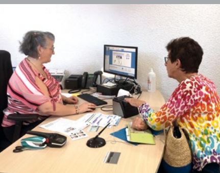
Nouveau service CNI/Passeport, page 8 ▲