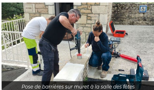
Pose de barrières sur muret à la salle des fêtes