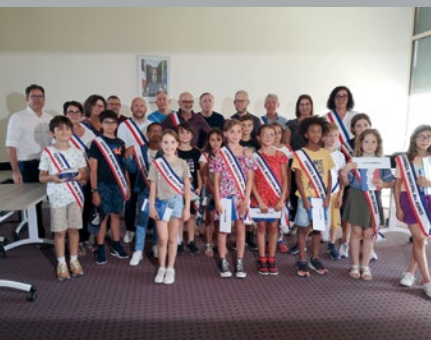
Conseil municipal des enfants, page 7 ▲