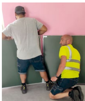
Mise en place de la classe ULIS à l'école Claude Roy