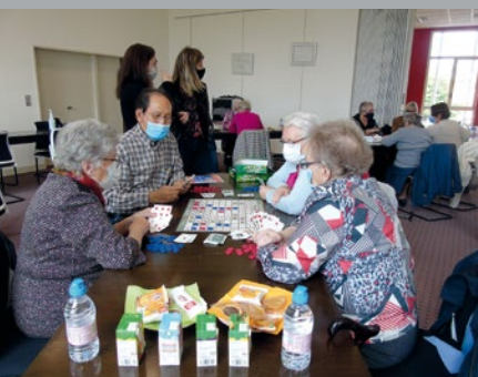
Semaine seniors, page 9 ▲