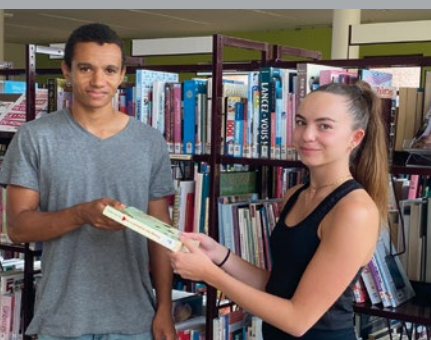
Médiathèque, page 10 ▲