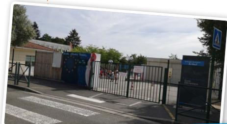
ÉCOLE PRIMAIRE Nicolas Vanier