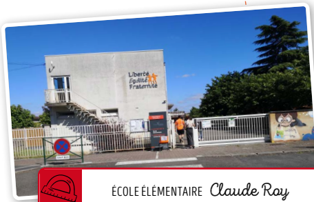
ÉCOLE ÉLÉMENTAIRE Claude Roy