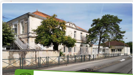
ÉCOLE MATERNELLE La Clairefontaine