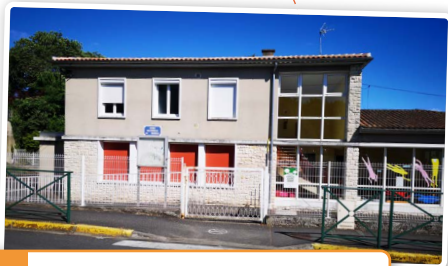
ÉCOLE MATERNELLE La Marelle