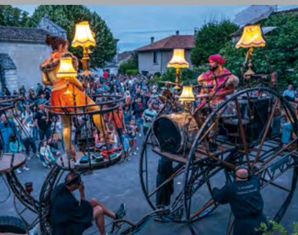
Les soirs bleus, page 10 ▲