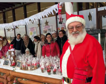
Retour en images, pages 2 à 3 ▲