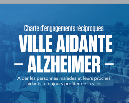
Charte «ville aidante», page 4 ▲