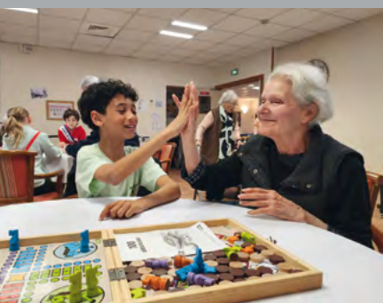
Visite à la maison de retraite, page 12 ▲