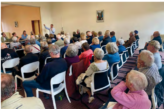
16 mai 2026 réunion avec le collectif santé