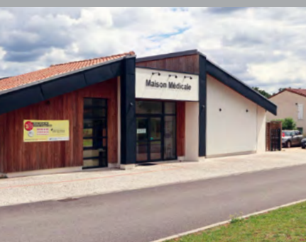
Des actions concrètes pour la maison médicale ▲ page 13