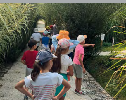
Le petit Arédien ▲ page 8