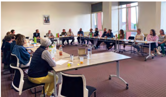
Rencontre du 13 mai avec les professionnels de santé