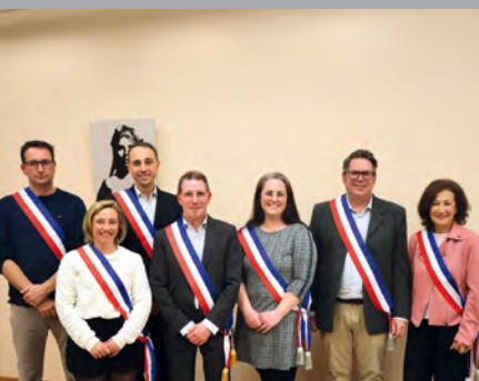
Nouvelle équipe municipale ▲ page 2