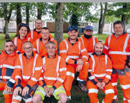
Portraits d'agents ▲ page 7